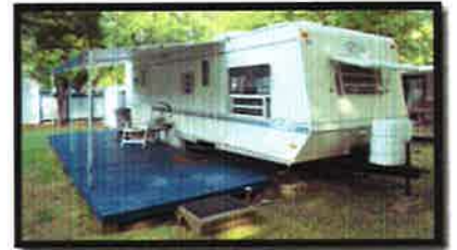
Plate-forme de bois d'une superficie maximale de 23,78 mètres carrés sans excéder la superficie de plancher de l'équipement principal. Elle est installée le long de l'équipement principal. Le patio est préassemblé en sections de 1,2 mètre sur 2,4 mètres de côté, et doit demeurer mobile et temporaire et non habitable et non attaché au sol et/ou à l'équipement de camping, utilisé accessoirement à l'équipement de camping.